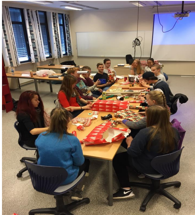
Salg og Service på Stangnes vgs