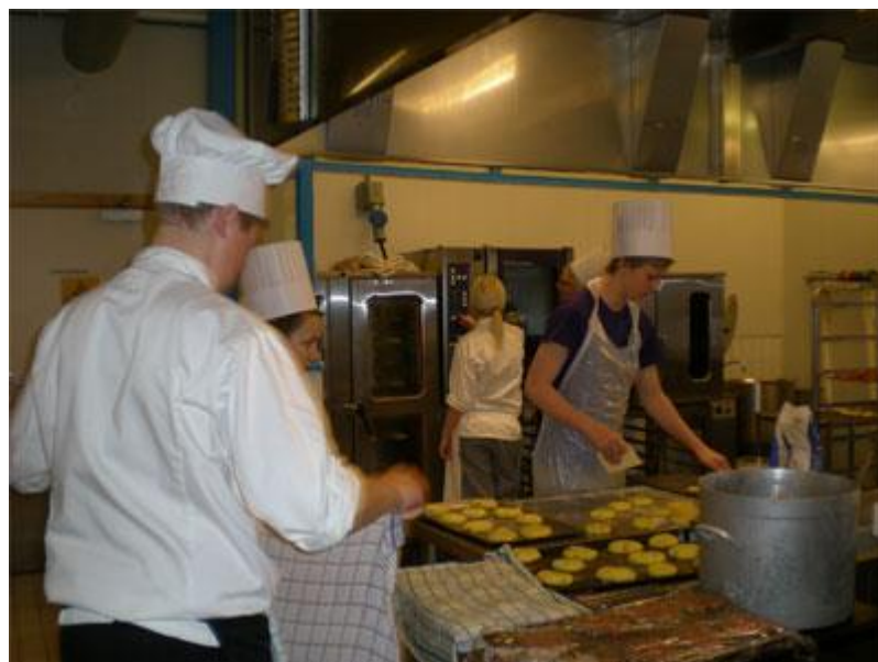
Restaurant- og Matfag på Rå vgs