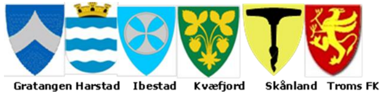
Gratangen Harstad Ibestad Kvæfjord Skånland Troms FK